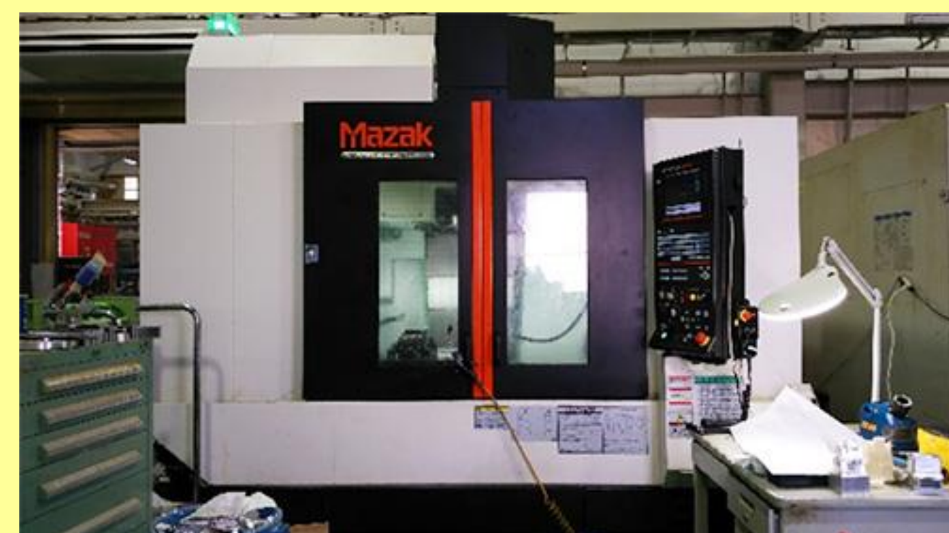
マシニングセンタ