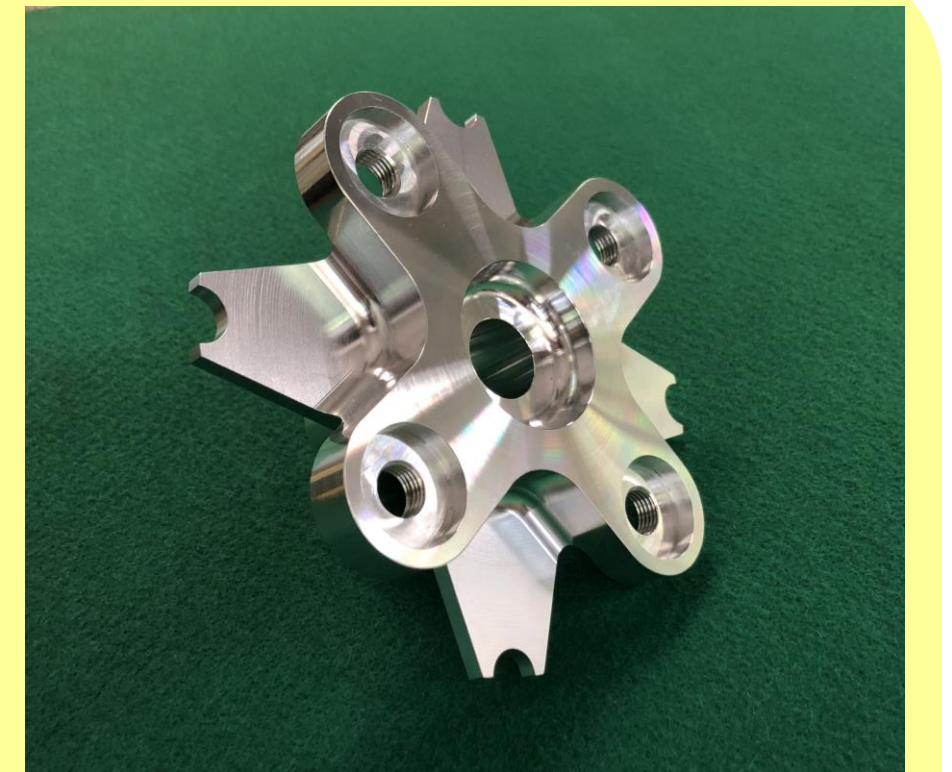
ターニングセンタ