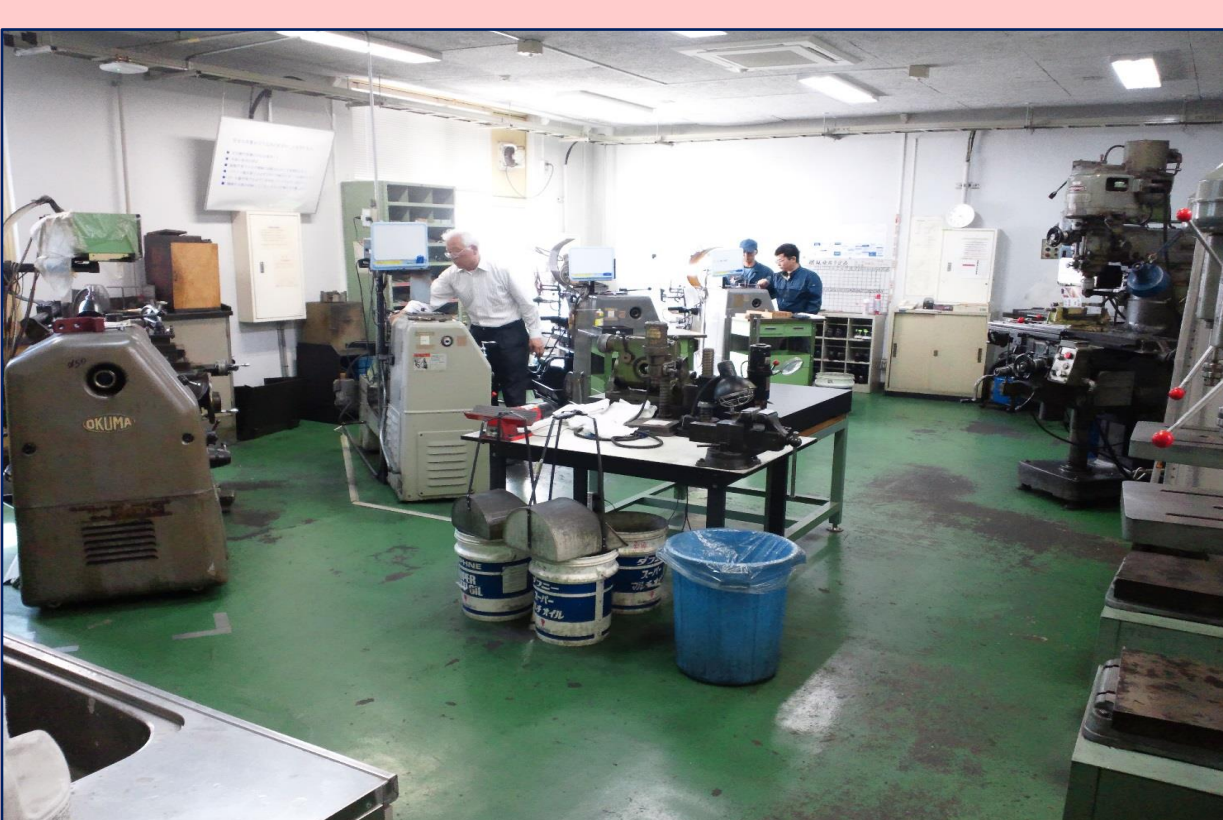
共同利用加工技術室