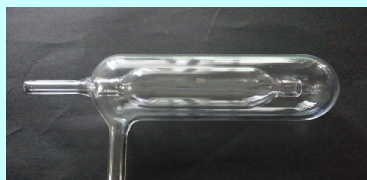
ガラス加工技術室