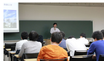
2018年度特別講義の様子

生産技術研究所と東京都市大学の学術連携に基づき、東京都市大学の大学院生を対象に特別講義を実施しています。2016年度から単位認定が行われる講義となり、2021年度は生研若手教員9名がそれぞれ100分×2回の講義を担当しました。