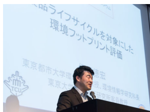
シンポジウム(2017年10月@生研)

学術交流、若手人材育成の一環として行われている共同研究を紹介するため、2012年10月、2017年10月に生産技術研究所にて、2013年7月、2020年10月に東京都市大学にて学術連携シンポジウムを開催しました。シンポジウム開催にあわせ、研究室見学会やポスターセッションの開催実績もあります。さらに、両校の教職員を対象とし、サロン形式による研究交流、話題提供も計5回実施し、活発な研究交流を実現しています。