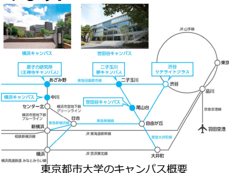
東京都市大学のキャンパス概要