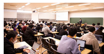
2022年度特別講義の様子