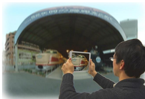
博物館探索VR「弁天町思い出のぞき窓」