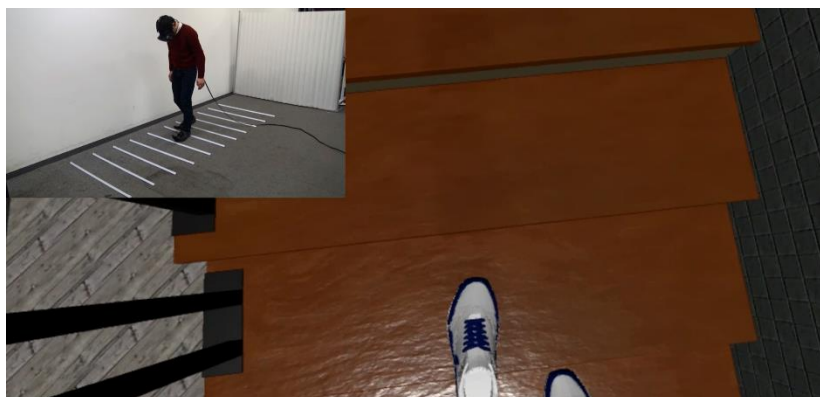
無限に階段を登れるVRシステム“Infinite Stairs”